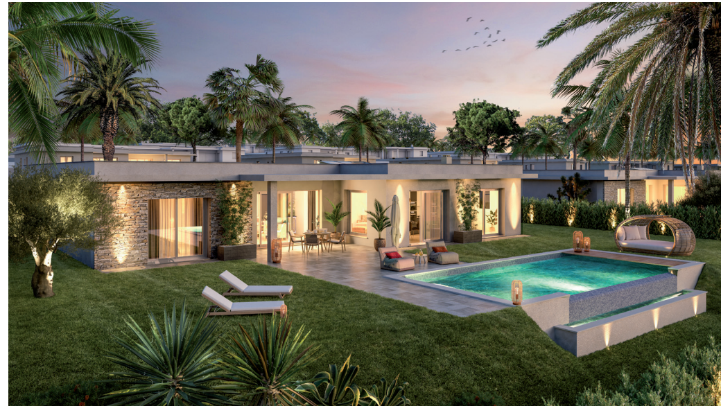
Quinta de Faro – Faro, Algarve, Portugal