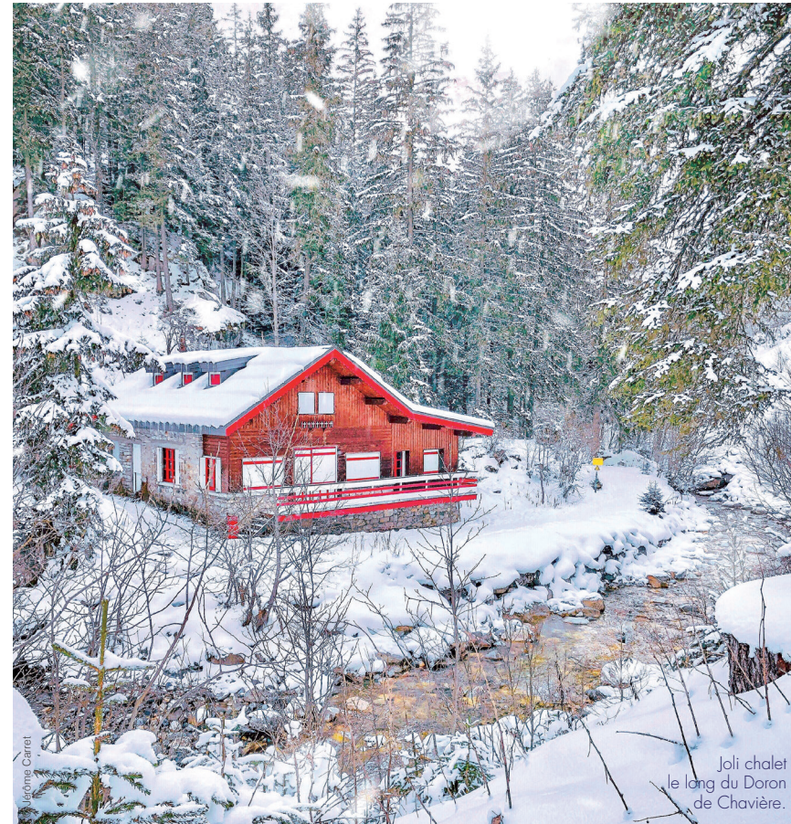
Joli chalet le long du Doron de Chavière.

Au-delà de ses 26 km de pistes balisées entre plateaux et forêts luxuriantes, le domaine attire les amateurs de ski nordique grâce à un site parmi les plus importants de Savoie. Pralognan-la-Vanoise possède aussi un site de ski de randonnée réputé pour la beauté de ses paysages. À ces activités de pure glisse s'ajoutent de multiples loisirs outdoor tels que les sorties en raquettes, le ski-joëring, la luge, la balade en calèche ou en compagnie de chiens de traîneau. Côté indoor , la station regorge d'équipements sport et bien-être (piscine, spa, patinoire, bowling, mur d'escalade, salle de sport...).