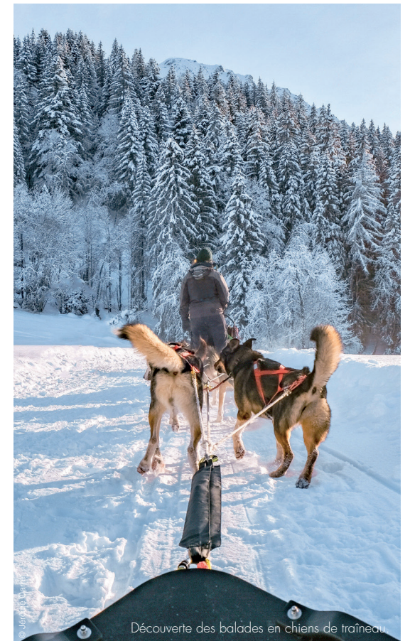
Découverte des balades en chiens de traîneau.