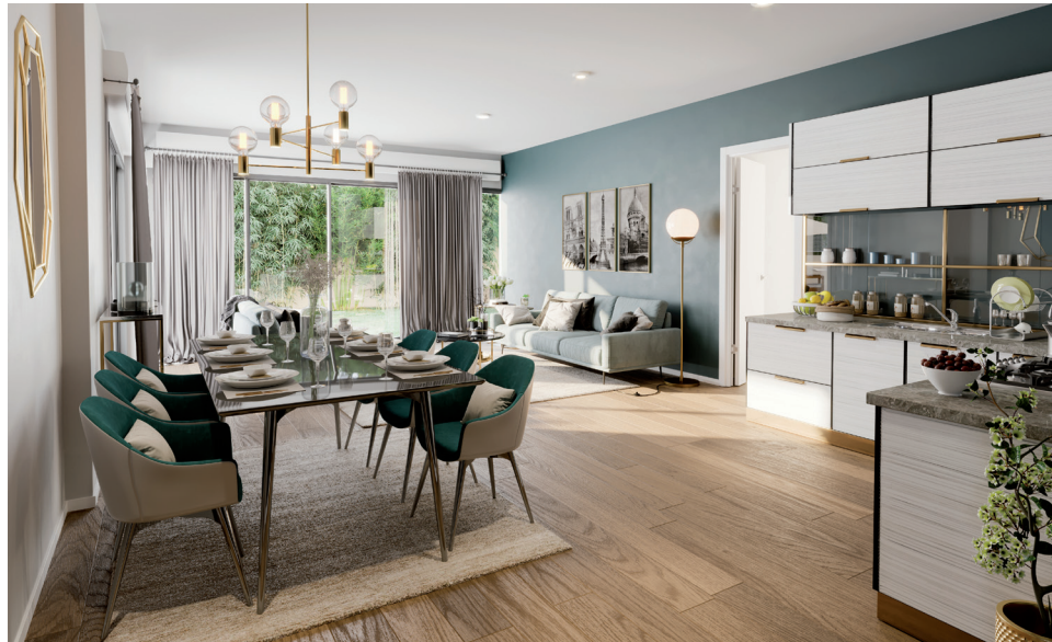
Domaine Naturel Seine – Corneilles-en-Parisis (95)