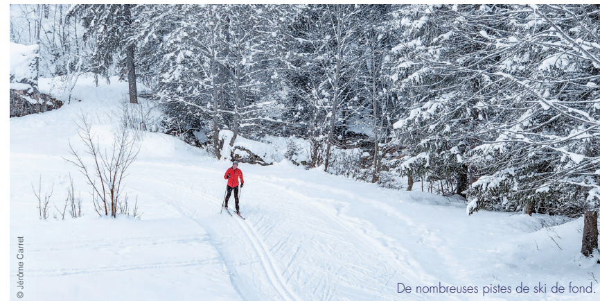
De nombreuses pistes de ski de fond.