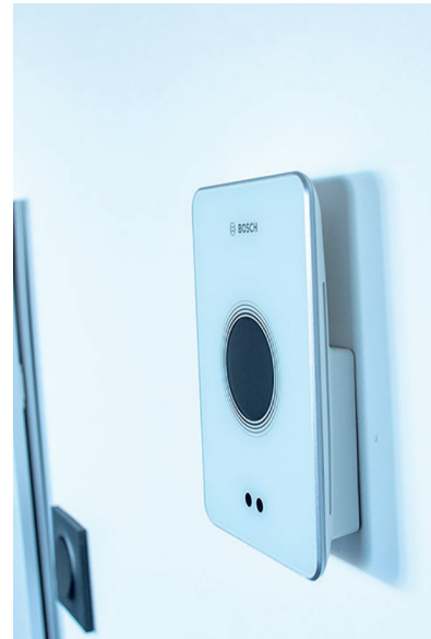
Domotique résidence MJ Développement L'Écrin - Arcs 1800 (73)