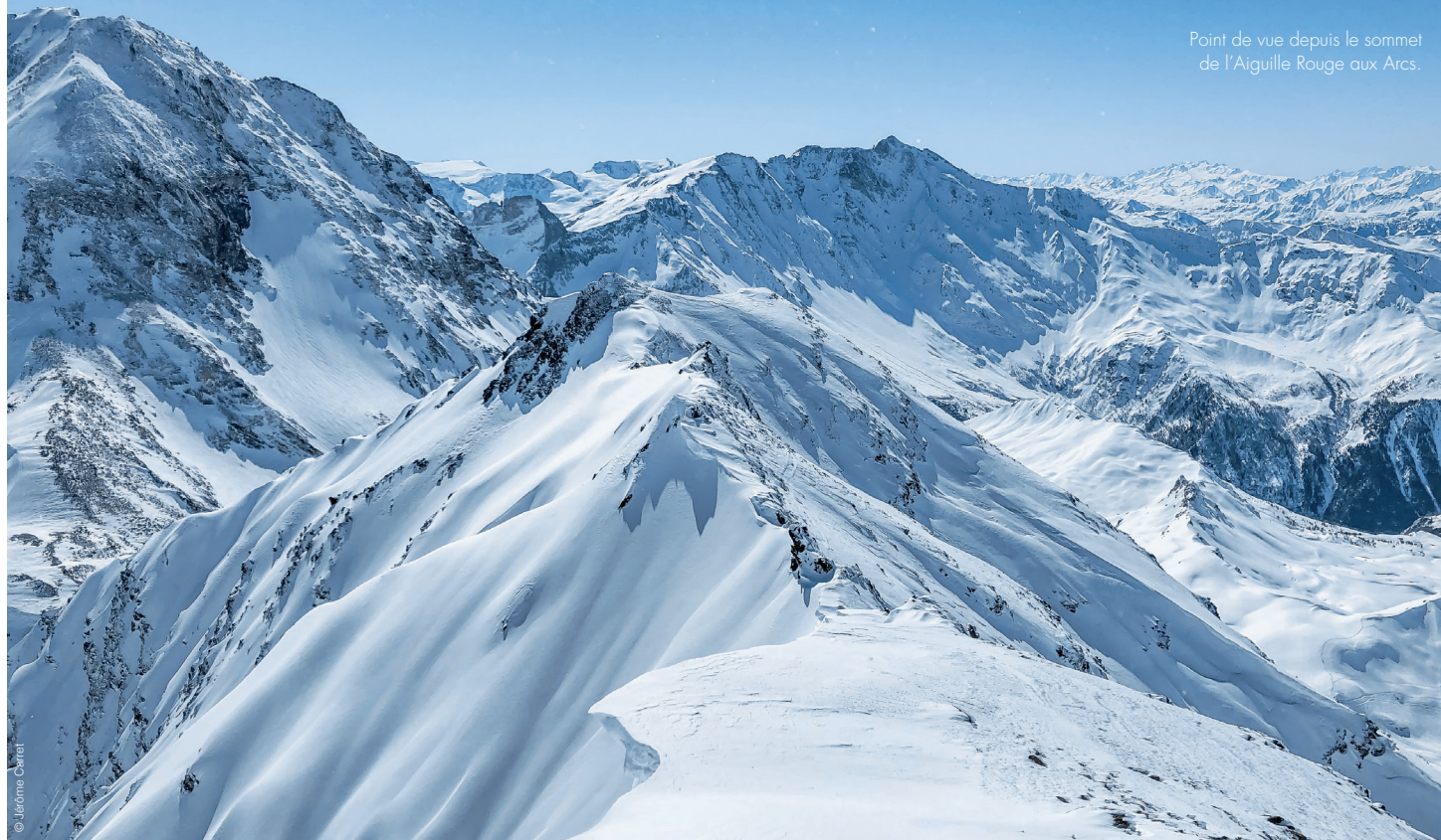
Point de vue depuis le sommet de l'Aiguille Rouge aux Arcs.