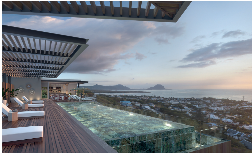
Resort Legend Hill – Rivière Noire, île Maurice