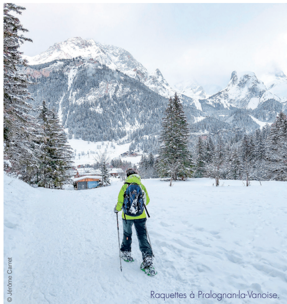
Raquettes à Pralognan-la-Vanoise.