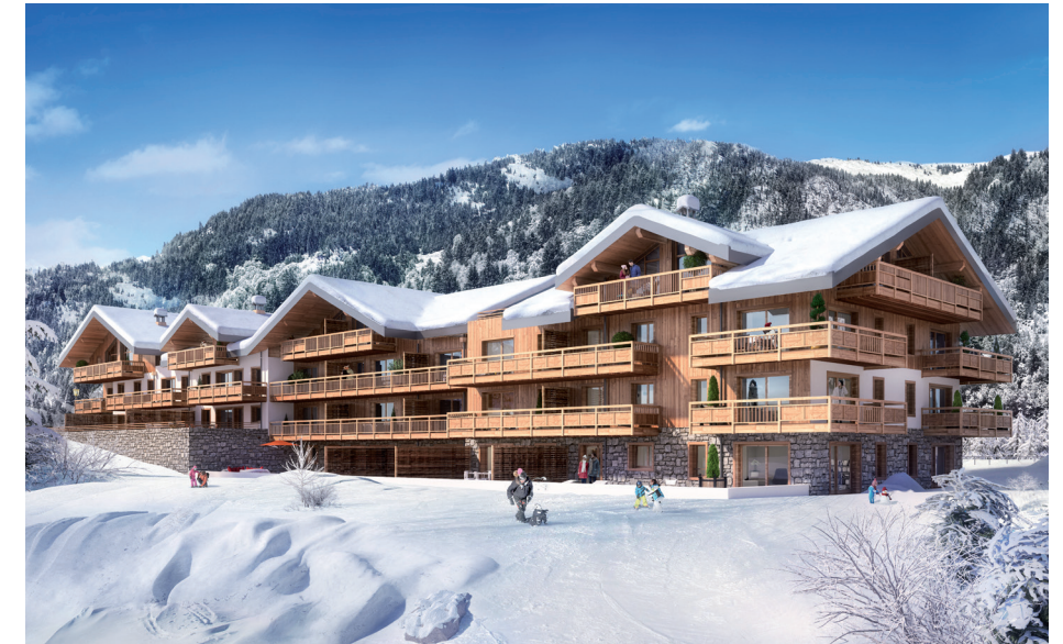
Les Terrasses de la Vanoise – Champagny-en-Vanoise (73)